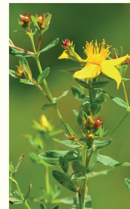
Prikbladet perikon, hvis knopper kan anvendes til kryddersnaps.

Udover at de blomstrende urter er skønne at betragte, er de til stor gavn for sommerfugle og andre insekter. På arealet findes blandt andet markkrageklo , hjortetrøst , hvid snerre , vellugtende agermåne , engbrandbæger , blåhat , stor knopurt samt en mængde græsser.