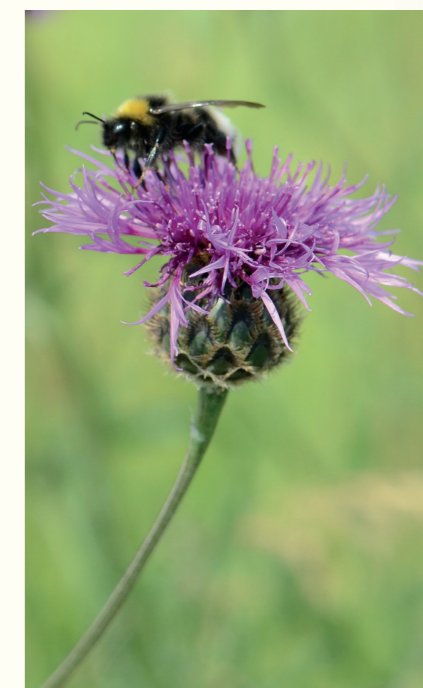
Stor knopurt tiltrækker såvel bier som dag- og natsommerfugle.