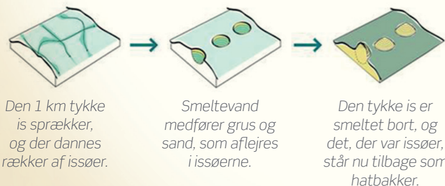
Figuren illustrer dannelsen af hatbakker.

Hatbakkerne ses stort set over hele Langeland med undtagelse af Ristinge Halvøen. I antal af over 1.000.